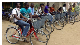
Diskutieren über SPEEK in den Gemeinden und lokalen Kliniken, Training der PEs, Aufbruch auf ihren Rädern in ihre Gemeinden.