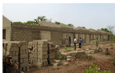
Aktueller Stand der neuen JHS.

Der Bau unserer JHS in Zongoire ist derzeit leider aus Geldmangel unterbrochen. Der Rohbau ist inzwischen abgeschlossen, jedoch fehlt uns noch die Finanzierung für das Dach, die Böden, Putz und Anstrich. Bei einem Charity Eislauf am 22. Januar sammelten SchülerInnen der holländischen Cobbenhagenmavo High School 1163 € für Baumaterial, um das Dach zu decken.