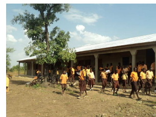
Eindelijk! Leerlingen en leraren genieten van de ruime klaslokalen tijdens het lesgeven en leren.