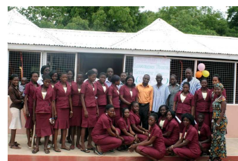
STEP-UP lancering, juni 2012

Mocht je interesse hebben in de producten van de STEP UP meiden en je bent op zoek naar een unieke laptop hoes, telefoonhoesje of een leuke tas (voor jezelf of als kado!) dan kun je ze online bestellen op: http://stepupfairtrade.wordpress.com/