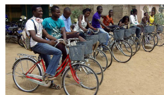
Bespreking SPEEK met gemeenschappen en met lokale klinieken, Training van PEs, Op de fiets naar eigen gemeenschappen.