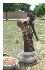
Edifici EPEFA (l); Congresso di EPEFA del 30 Maggio (m); agricoltore di EPEFA durante la preparazione delle arachidi (r).