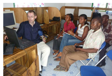
Computer training allo staff di YHFG.